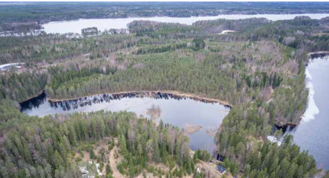
Kuva Tunturilammista on otettu 26.4.2018, sulamisvesien ollessa korkeimmillaan. Kesällä Tunturilammin pinta on lähes kokonaan kasvuston peitossa. Taustalla Renkajärven eteläosa, oikealla pilkottaa Onkilampi.

Vielä lopuksi on syytä mainita, että Tunturilammin pohjoispuolella olevan Onkilammin kohdalla suoritettiin kesällä 2017 kolmas perättäinen vesikasvillisuuden niitto ja juurakkojen jyrästä. Näillä toimenpiteillä saadaan lammin keskiosa ja rannalle johtavat väylät pidettyä auki. Kunnostuksesta aiheutuneet kustannukset on katettu suojeluyhdistyksen saamin avustuksien ja Onkilammin rannan asukkailta kerätyin maksuin.