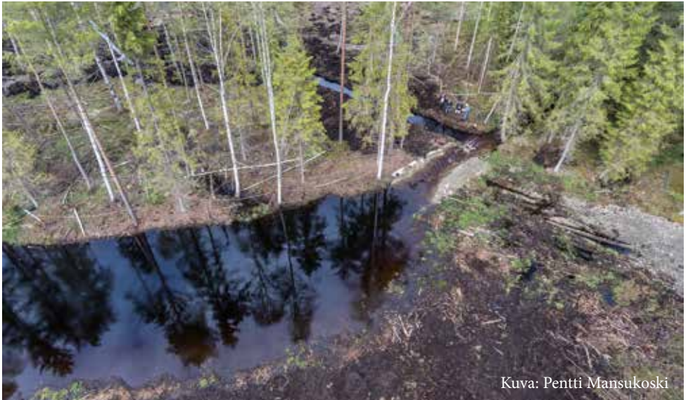
Kuva: Pentti Mansukoski